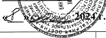
График проведения первичной и первично специализированной аккредитации